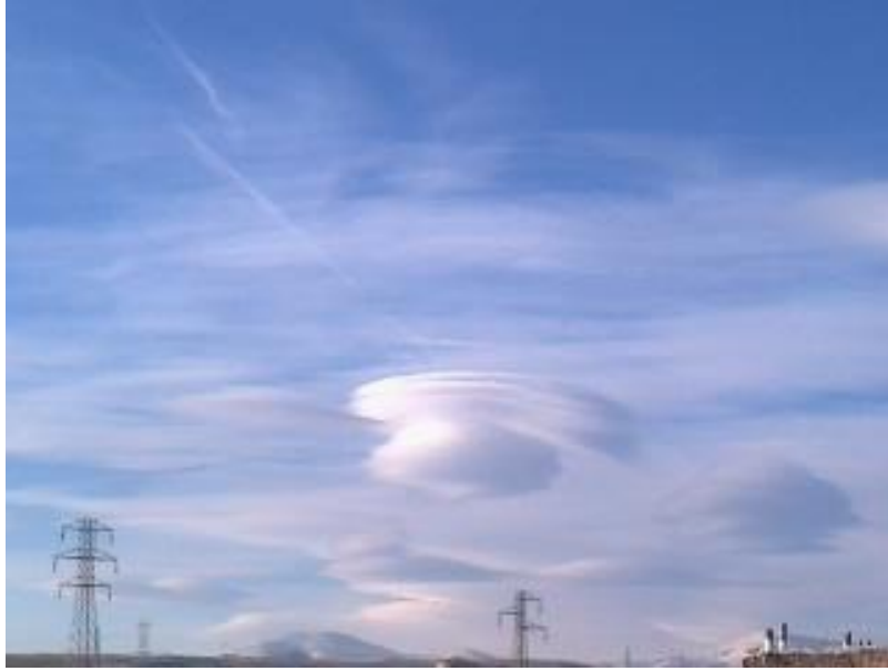
نمونه دیگری از یک ابر عدسی شکل بر فراز شهر اهر