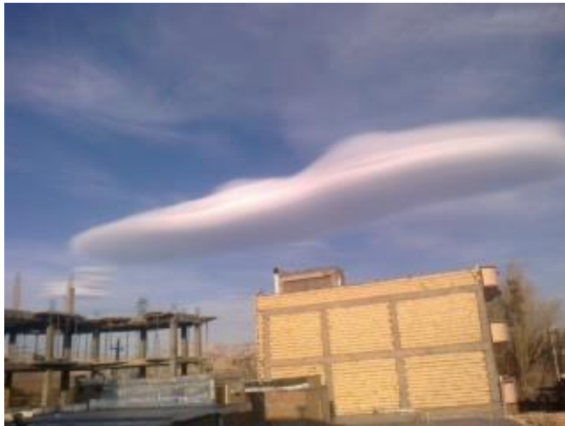
ابر عدسی شکل کشیده بر فراز اهر